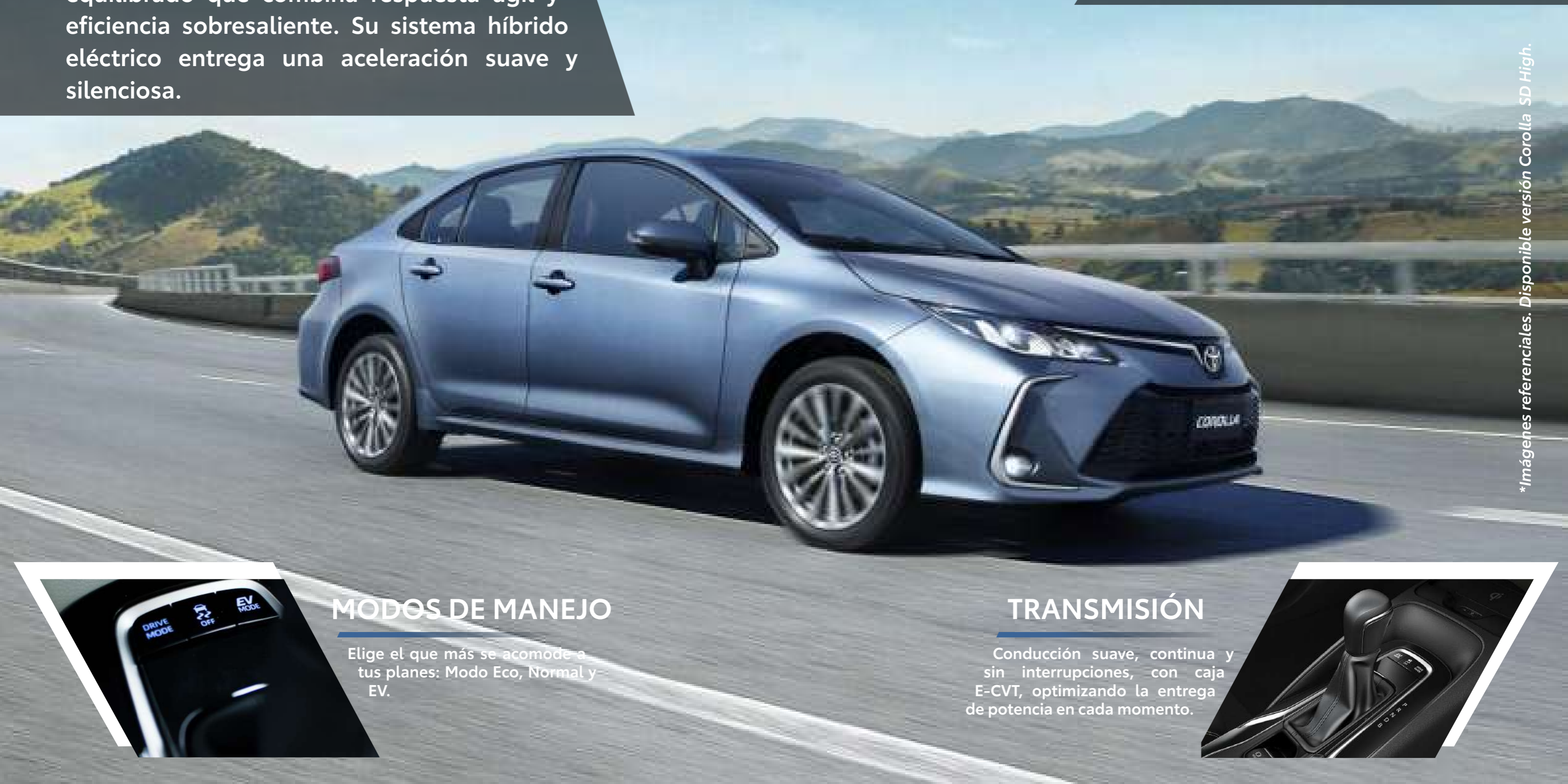
*Imágenes referenciales. Disponible versión Corolla SD High.

Experimenta la sinergia que existe entre el motor eléctrico y a gasolina en COROLLA HEV, logrando generar una potencia combinada de hasta 117 HP.